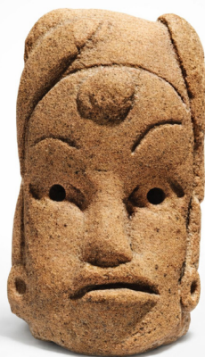
Mexiko - Präklassikum

Alle Kurse sind für Anfänger sowie Fortgeschrittene geeignet. Die Themen bieten Anregungen – wogegen es nicht zwingend notwendig ist, themenbezogen zu arbeiten. Die Kurse kosten € 190,- zzgl. Materialkosten.